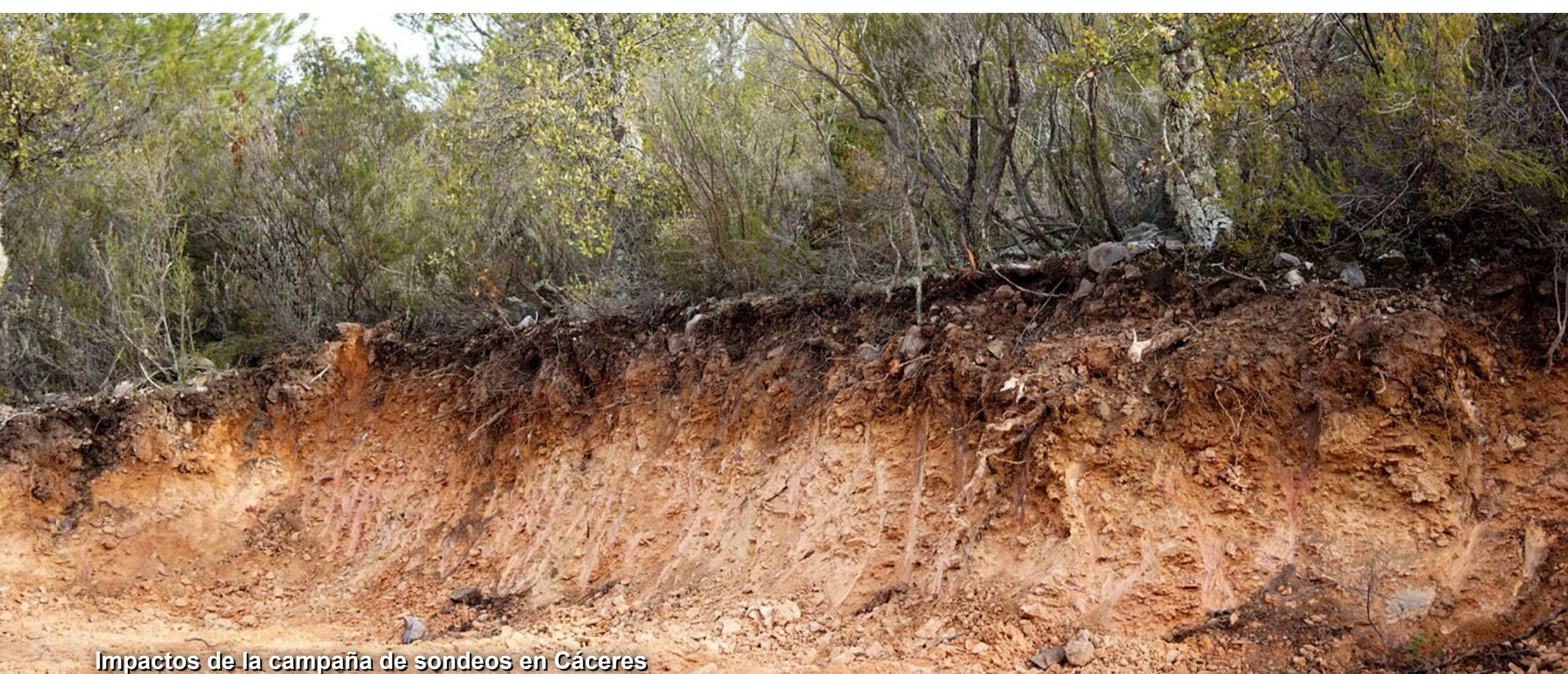
Impactos de la campaña de sondeos en Cáceres

La mina propuesta se abriría en la Sierra de La Mosca, que está en proceso de ser declarada Paisaje Protegido y está conectada con el espacio protegido 'Llanos de Cáceres y Sierra de Fuentes', designado como Zona de Especial Protección para las Aves de la Red Natura 2000. La mina propuesta se encuentra a sólo 1 km de la ciudad de Cáceres, declarada Patrimonio de la Humanidad por la UNESCO desde 1986 y con una población cercana a los 100.000