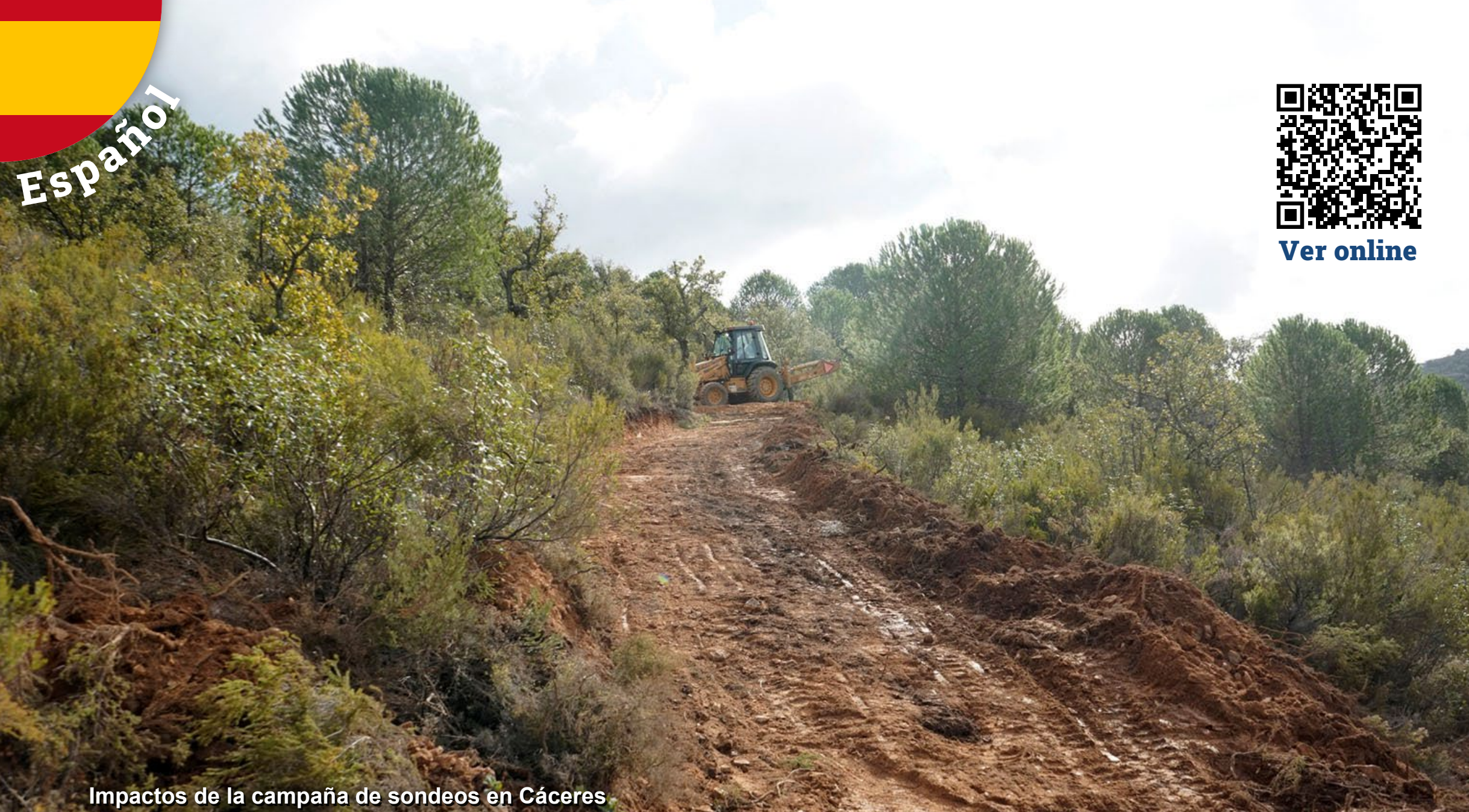
Impactos de la campaña de sondeos en Cáceres