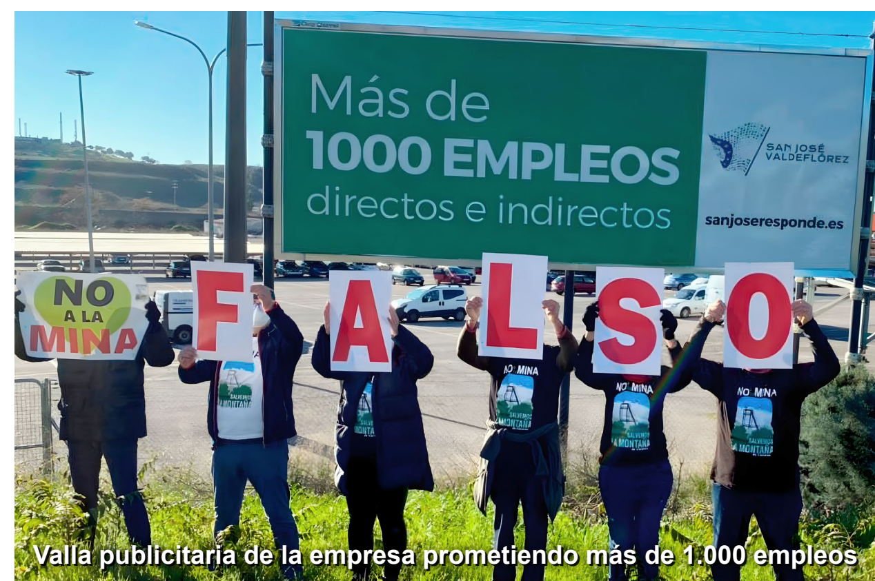
Valla publicitaria de la empresa prometiendo más de 1.000 empleos

La empresa minera también ha emprendido o amenazado con emprender acciones legales (SLAPP) contra un periodista que divulgó una serie de mensajes en el foro de accionistas de la matriz australiana, en los que se sugería sobornar a políticos locales para eliminar los obstáculos urbanísticos.